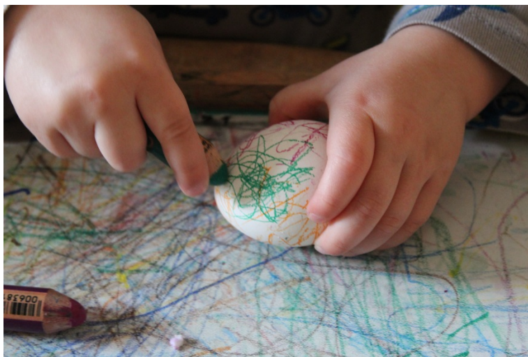
Hartgekochte Eier werden mit weichen Buntstiften bemalt

Bald darauf folgte auch schon die Osterzeit. Wir haben Hefehasen gebacken, Eier bemalt und in die mit Farbe gestalteten Tontöpfchen Ostergras gesät. Im Kinderkreis konnten wir täglich beobachten wie die Halme immer weiterwuchsen. Am letzten Tag vor den Osterferien folgte unsere „Kind-Eltern-Osternest-Suche“ am Gründonnerstag.