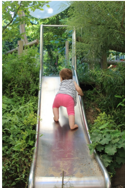
Ganz junge Kinder besuchen nun wieder unser Haus.

Anfang August, nach unserer dreiwöchigen Schließzeit, begann das neue Kitajahr. Sechs Kinder begannen ihre Eingewöhnungszeit bei uns und bereichern nun mit ihren Familien unser Haus.