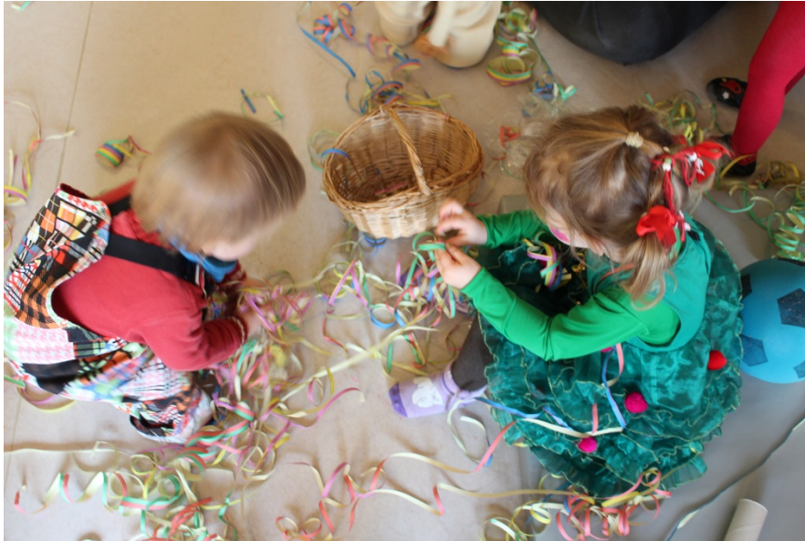
Viele bunte Luftschlagen! Überall!

Der erste Höhepunkt im neuen Kitajahr war unser alljährliches Karnevalsfest. Bereits im Vorhinein wurden Kamellebüggel gestaltet, kölsche Lieder gesungen und die Verkleidungssachen bereitgestellt. An Altweiberfastnacht haben wir dann mit Luftschlangen, Musik und Ballons ein buntes Fest gefeiert. Um 11:11 Uhr wurde das Karnevalsbuffet mit Würstchen, Brezeln, Berlinern und Rohkost eröffnet, bevor wir uns dann in die Karnevalsschließzeit verabschiedet haben.