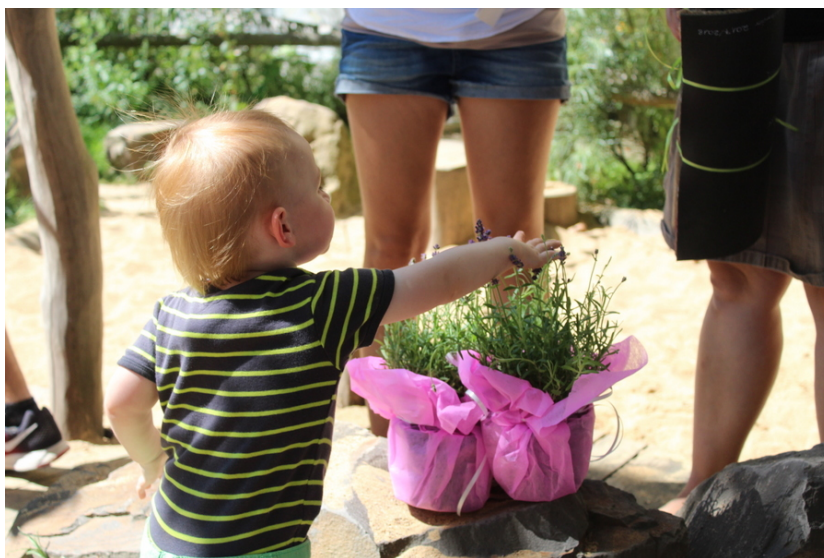
Abschiedsgeschenke beim Sommerfest

Ende Juli, auf unserem Sommerfest wurden Kinder und Mitarbeiter verabschiedet, die die H.d.F.-Pünktchen verlassen haben. Bei strahlendem Sonnenschein, einem reichhaltigen Buffet und Wasserbomben mischten sich lachende und weinende Augen.